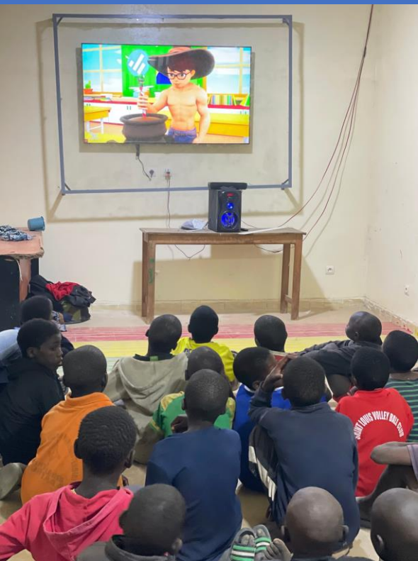
La télé de notre bibliothèque récemment rénovée attire de nombreux talibés mendiants.