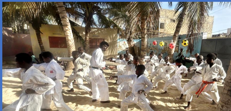
Cours de karaté du matin au centre