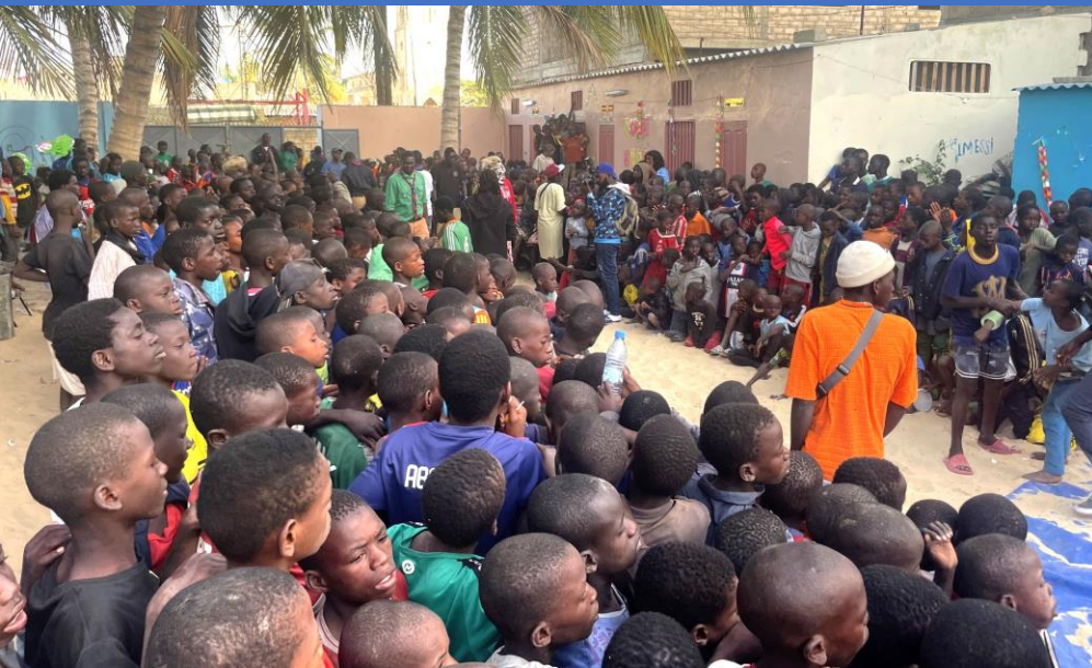
Enfants talibés mendians en grand nombre dans notre centre