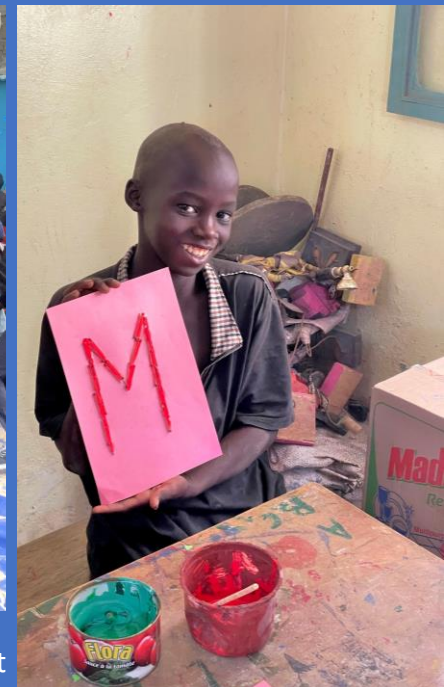
Passionné dans un atelier d'art