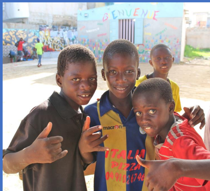
Heureux d'être en sécurité et soigné