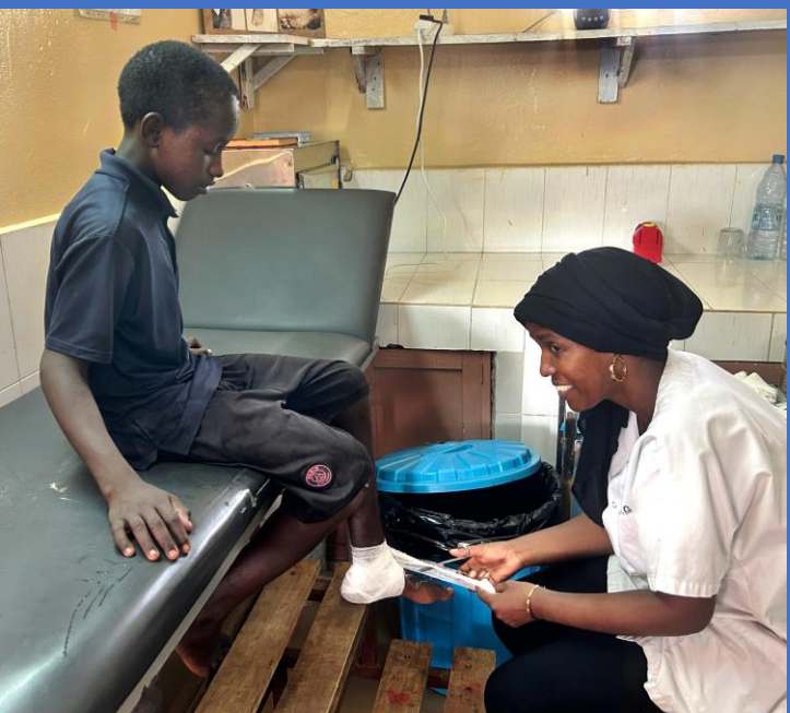
Soigné dans notre infirmerie