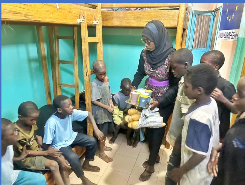
Notre dortoir d'urgence surchargé accueille des centaines d'enfants de la rue.