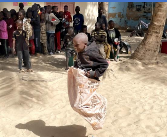
Une chance de jouer comme enfants