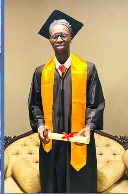
Moment de fierté pour un talibé devenu diplômé universitaire